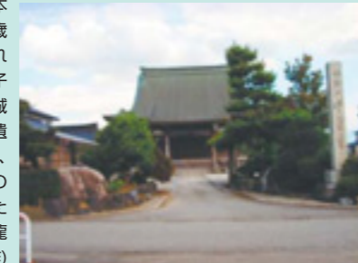
根本山中堂寺正面