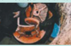
向野池遺跡から出土した瓦塔(発掘調査時の写真、富山市HPより)