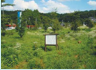
古沢遺跡の現地案内板