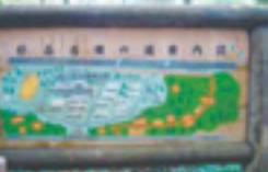
杉谷古墳群の現地案内板