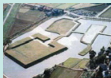
安田城跡の空中写真