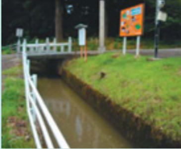
神社前を流れる古沢用水