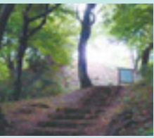
古沢塚山古墳周辺