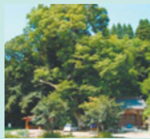
朝日の滝の大きなケヤキ