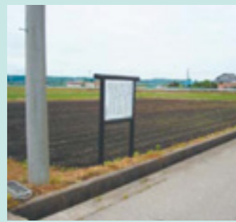
栃谷南遺跡の現地案内板